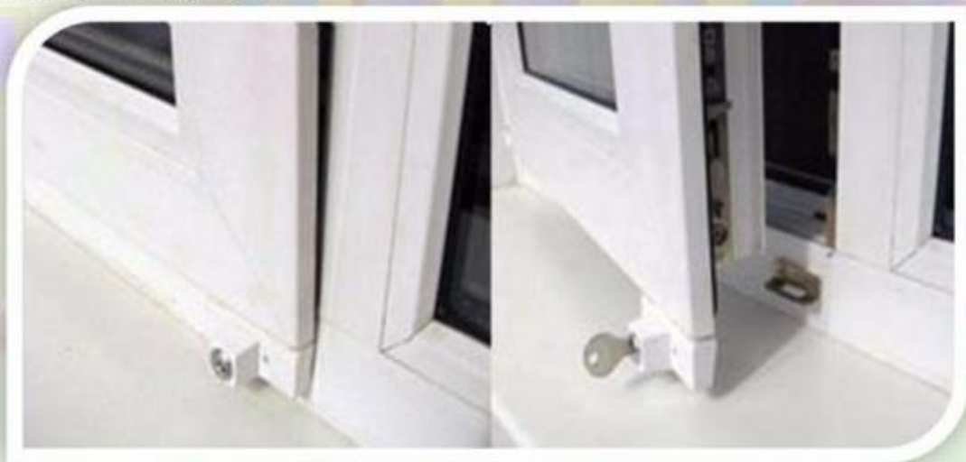
Замок блокировщик с ключом

Можно воспользоваться специальными замками блокираторами, которые предлагают установщики пластиковых окон.